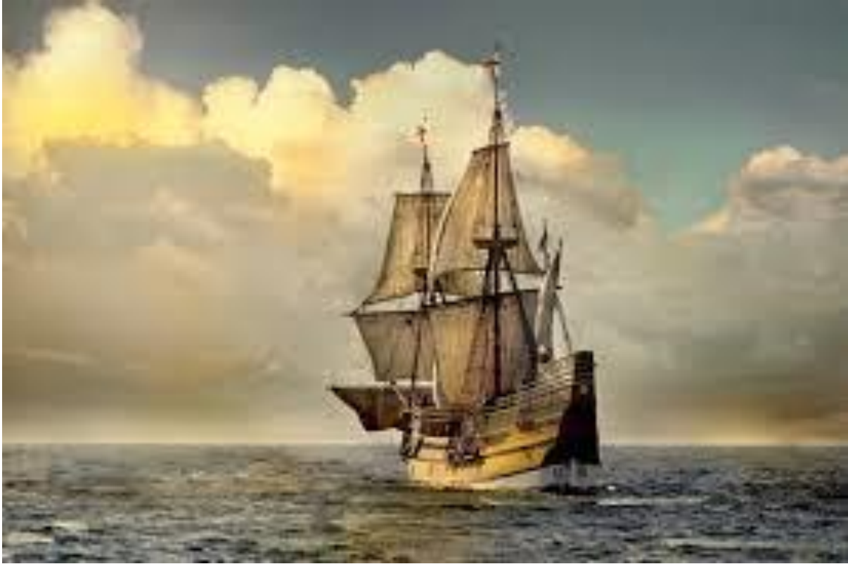
Une réplique du Mayflower