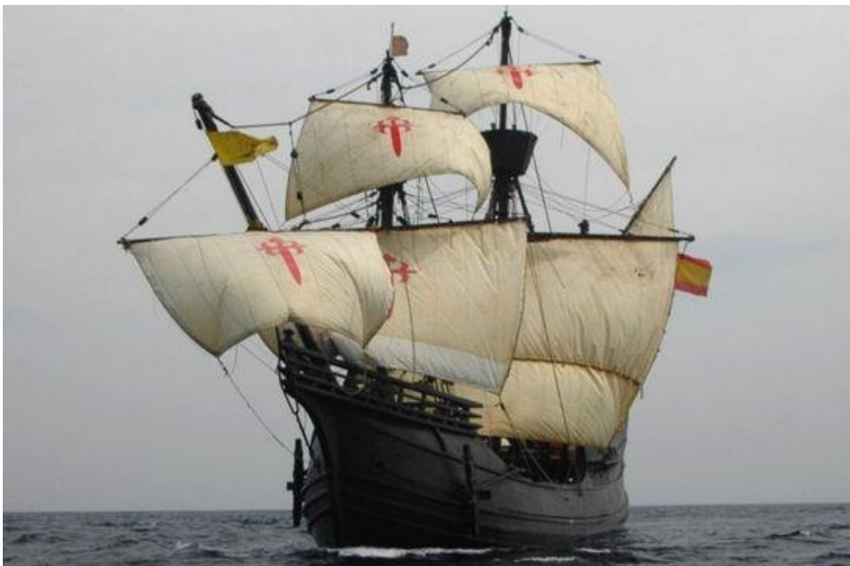
Une réplique du Victoria , premier navire à avoir effectué le tour du monde

Au terme d'une traversée laborieuse, les navires finissent par atteindre les côtes brésiliennes à la fin de l'année et entreprennent l'exploration méticuleuse de la côte en progressant vers le sud. Les explorateurs ont un espoir lorsqu'ils pénètrent dans le Rio de la Plata. Comme Diaz de Solis en 1516, ils pensent avoir trouvé le fameux « passage ». Déception, c'est un fleuve. Ne découvrant pas le détroit espéré, Magellan décide de passer l'hiver austral dans la baie de San-Julian ; il y fait mouiller ses navires en mars 1520. Au retour des beaux jours, les aventuriers reprennent l'exploration des côtes et la recherche d'un passage.