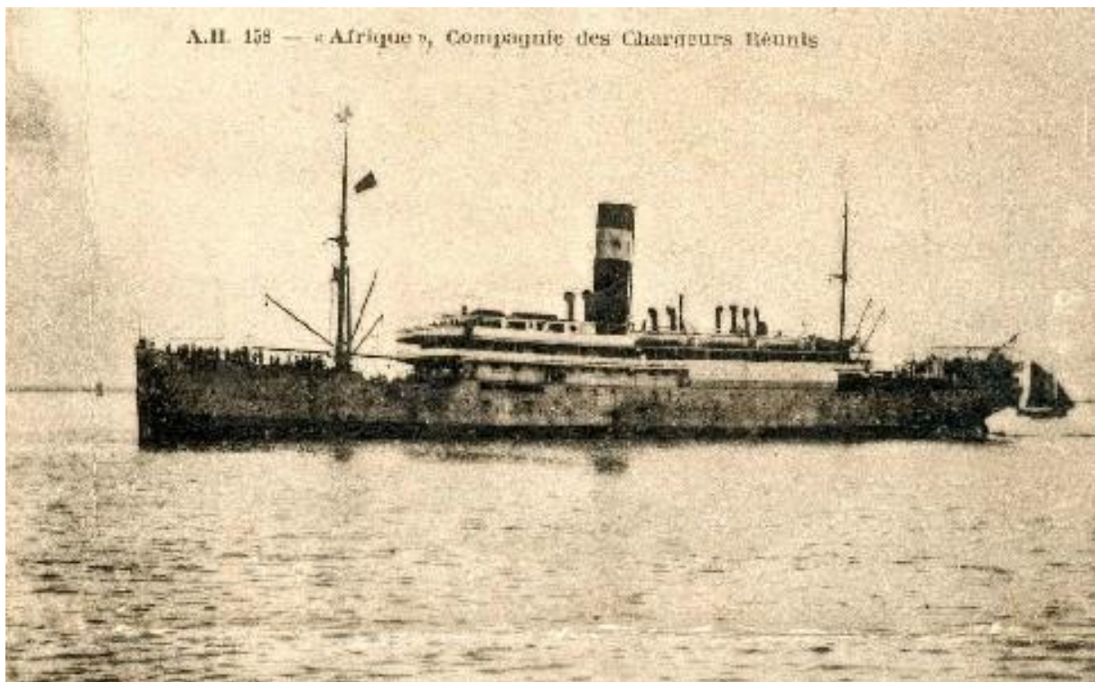
Le paquebot Afrique

Une heure plus tard, la machine signale une présence anormale d'eau dans les cales et la chaufferie. Les pompes sont mises en action, mais sans grand résultat. La chaufferie de tribord est bientôt hors d'usage. Pendant toute la journée du samedi 10, l'équipage lutte contre l'adversité, tandis que l'inquiétude du commandant Le Dû croît au fil des heures. Vers minuit, en concertation avec ses officiers, il décide d'aller mouiller en rade de La Pallice. Il n'y parvient pas : la machine fonctionne de plus en plus mal et le gouvernail commence à donner des signes de faiblesse. Pendant toute la nuit, le navire est le jouet d'une mer déchaînée, contre laquelle il a bien du mal à lutter.