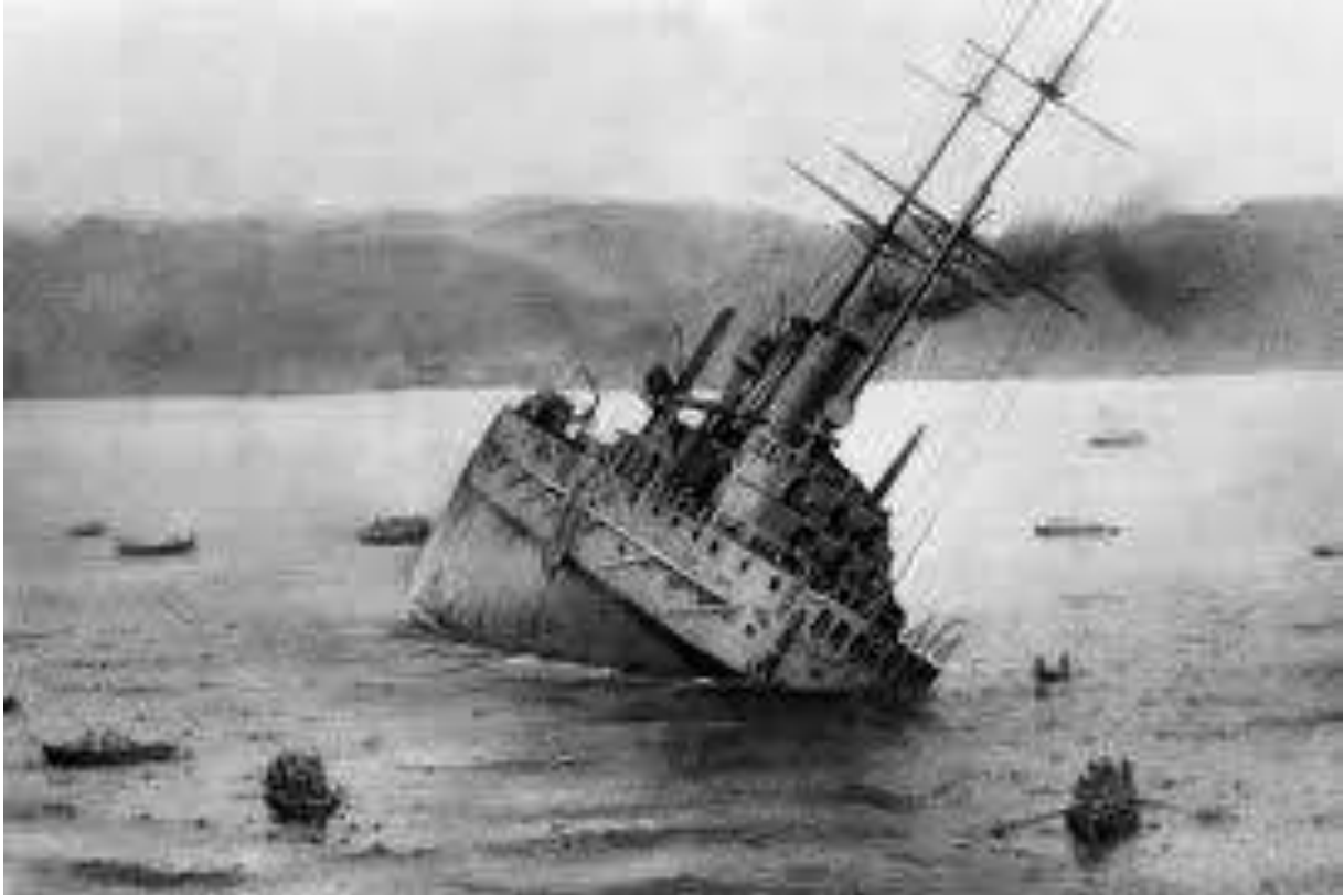
La fin du Viribus Unitis