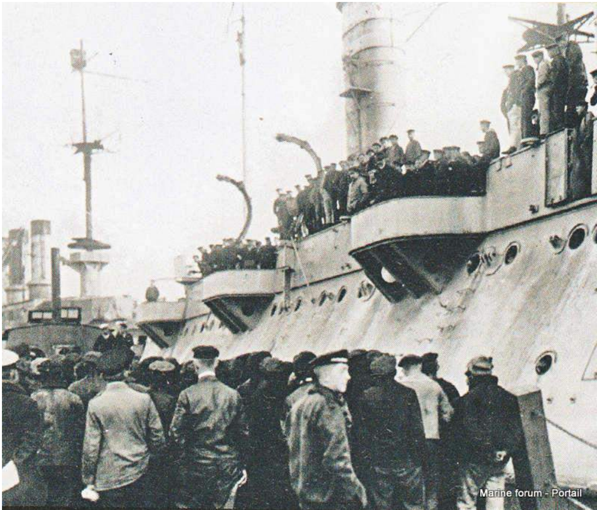
Les mutineries de Kiel (Novembre 1918)

manifestants ; elle ouvre le feu ; une mêlée confuse se produit ; on déplore des blessés et des morts dans les deux camps.