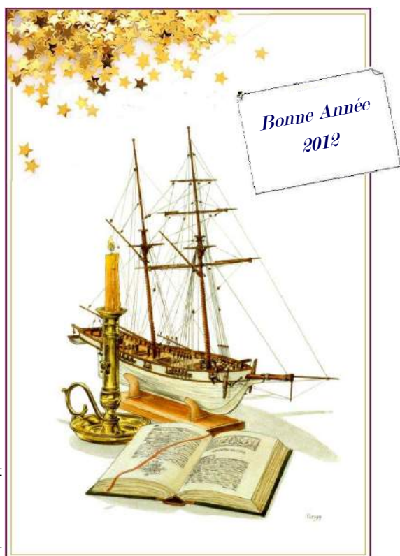
Aquarelle de Philippe PERSY