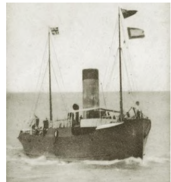
Dieppe, le 21 novembre 2020 Cérémonie de pose de la plaque du "Vapeur" MAINE torpillé le 21 novembre 1917

Les adhérents du Mérite maritime se sont trouvés un peu frustrés que leur organisation ne soit pas citée en début de cérémonie comme les autres ... ce qui n'est pas du fait de l'ADMMAC. Nous ne doutons pas que la mairie rectifiera à l'avenir !