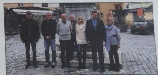
La réunion a eu lieu il y a quelques jours.